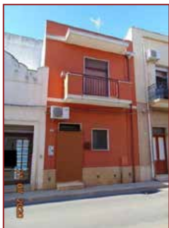
SAN VITO DEI NORMANNI - VIA LORENZO BERNINI, 2/A